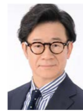
株式会社 マネジメント・ラーニング 代表取締役 博士(政策科学)