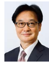
株式会社 ヒューマビリティ 代表取締役