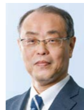
株式会社アタックス クラフトパーソンズ・センター 主席コンサルタント

～財務諸表(P/L・B/S・C/F)を理解し、経営課題発見に取り組む力を身につける～