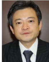
公認会計士・税理士