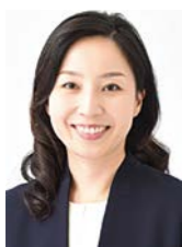
ペタルーダ・マインド株式会社 代表取締役