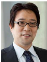
スカッデン・アープス 法律事務所 弁護士