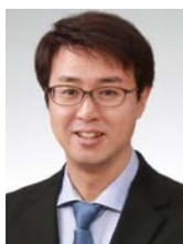
望月公認会計士事務所 代表 公認会計士