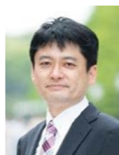
管理会計ラボ株式会社 代表取締役 公認会計士