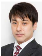
牛島総合法律事務所 パートナー弁護士