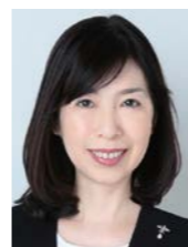
株式会社コントロール 代表取締役