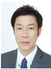
ライズメソッド株式会社 代表取締役