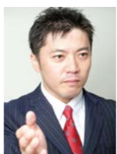
株式会社 Cube Roots 研修講師