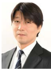
株式会社シナプス 代表取締役社長