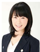
税理士、米国税理士 CFP®