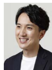
株式会社アクビー 代表取締役 NPO法人プランディングポート 代表理事