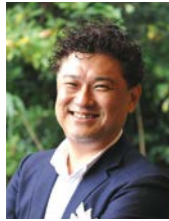
一般社団法人人間塾 代表理事 一般社団法人 日本コンセンサスビルディング協会 代表理事 株式会社小倉広事務所 代表取締役