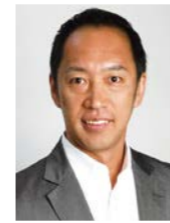
有限会社プラントライブ 代表 パーソナルブランド コンサルタント