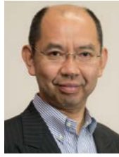
早稲田大学ビジネススクール 教授 公認会計士