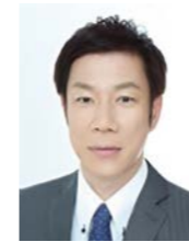
ライズメソッド株式会社 代表取締役